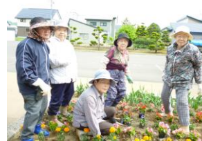
皆さんお疲れ様でした♪

5月29日(金)、支援ハウス入居者の方と援助員で花植えを行いました。ベコニア、マリーゴールド、ペチュニア、サルビアの4種類を、色や配置の工夫をしながら植え、約1時間程度の作業となりました。赤、黄、ピンク等、色とりどりのきれいな花壇が完成し、入居者の方や来訪者の目を楽しませてくれています。